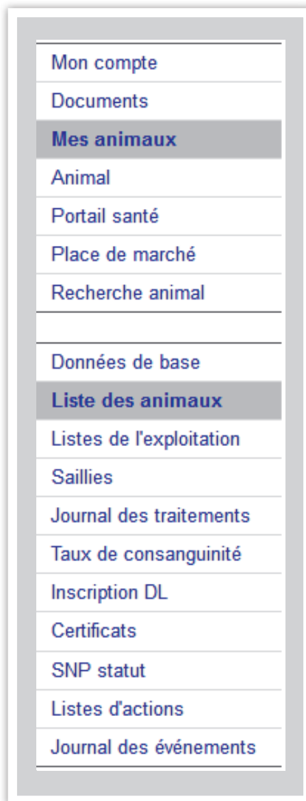
Le nouveau menu de BeefNet.

Les bases de données telles que BeefNet ont besoin d'être entretenues. Il peut arriver que les licences des programmes auxiliaires expirent ou que la structure ne soit plus adaptée. Une combinaison de différents facteurs a contraint les fédérations d'élevage affiliées à Qualitas AG à procéder à une révision de la